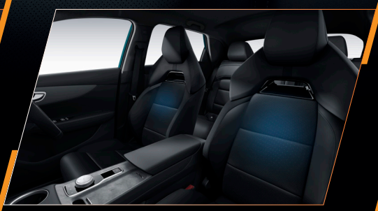
เบาะคู่หน้าดีไซน์สปอร์ต โอบกอด-ซับรับสรีระ พร้อมระบบปรับไฟฟ้า 6 ทิศทาง และระบบเป่าลมเย็น COOLING SEATS เย็นสบายตลอดการเดินทาง