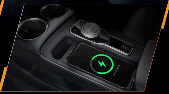
มอบประสบการณ์ไร้สายให้ชีวิตคุณง่ายขึ้น รองรับทั้ง Apple CarPlay™ และ Android Auto™ แบบไร้สาย พร้อมแท่นชาร์จสมาร์ทโฟน WIRELESS CHARGER