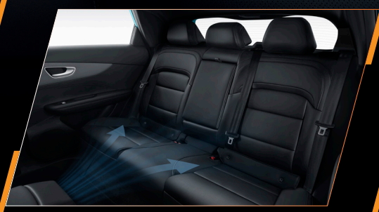
ยกระดับความผ่อนคลายให้ผู้โดยสารตอนหลัง ด้วยช่องปรับอากาศแยกส่วน และที่วางแขนดีไซน์พรีเมียม พร้อมทั้งวางแก้วน้ำในตัว