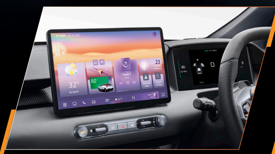
หน้าจอสัมผัสขนาด 12.8 นิ้ว คมชัดระดับ HD พร้อม INTERFACE ใหม่ ตอบสนองรวดเร็ว และหน้าจอแสดงผลการขับขี่ขนาด 10.25 นิ้ว

ยกระดับสุนทรียภาพการขับขี่ ด้วยห้องโดยสารดีไซน์ใหม่ ตกแต่งด้วยวัสดุพรีเมียมโทนสีดำ พร้อม DOUBLE LAYER CONSOLE ที่ผสานความหรูหราเข้ากับฟังก์ชันการใช้งานจริงได้อย่างลงตัว